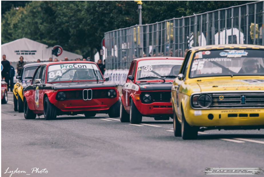
Classic Race – Aarhus Dom af 13. marts 2023