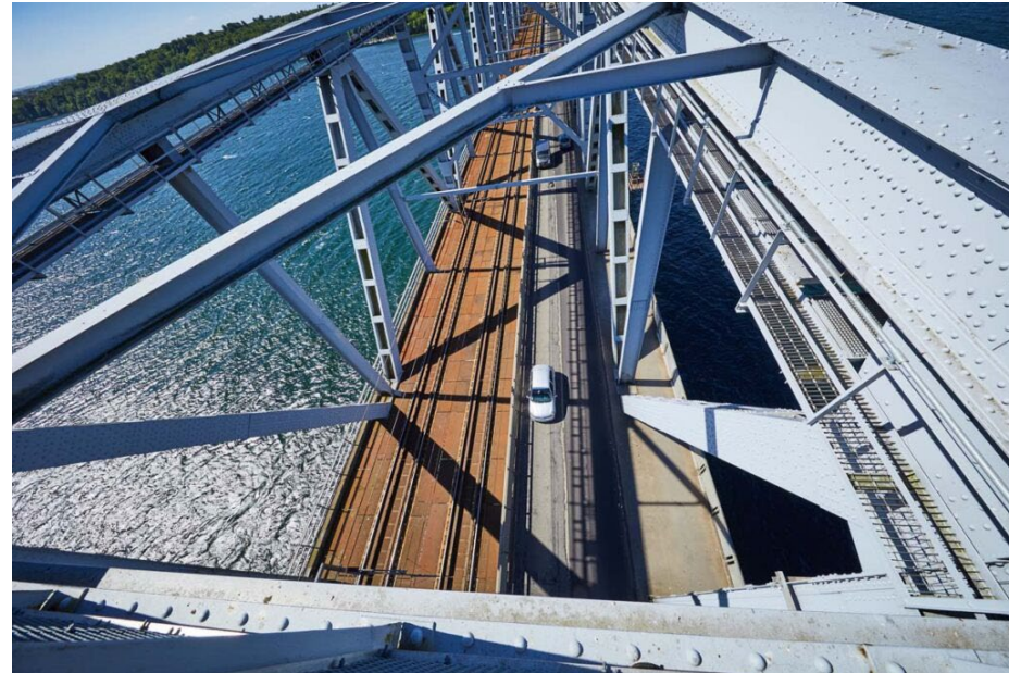
Bridgewalking Lillebælt Dom af 21. maj 2021