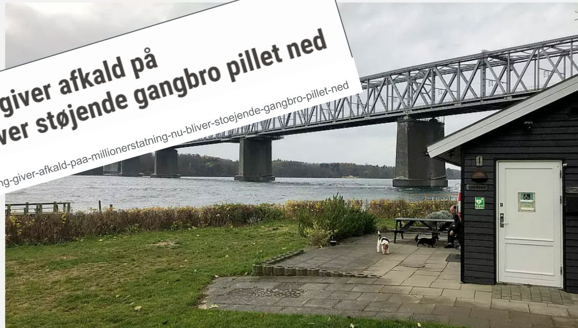
Ni naboer til Bridgewalking har sammenlagt fået 1.250.000 kroner i erstatning.

Kilde: Fredericia Dagblad. Link: https://frdb.dk/fredericia/naboer-til-bridgewalking-giver-afkald-paa-millionerstatning-nu-bliver-stoejende-gangbro-pillet-ned