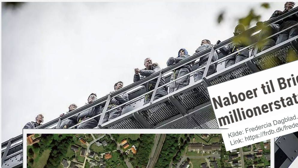
Flere beboere i deres huse.